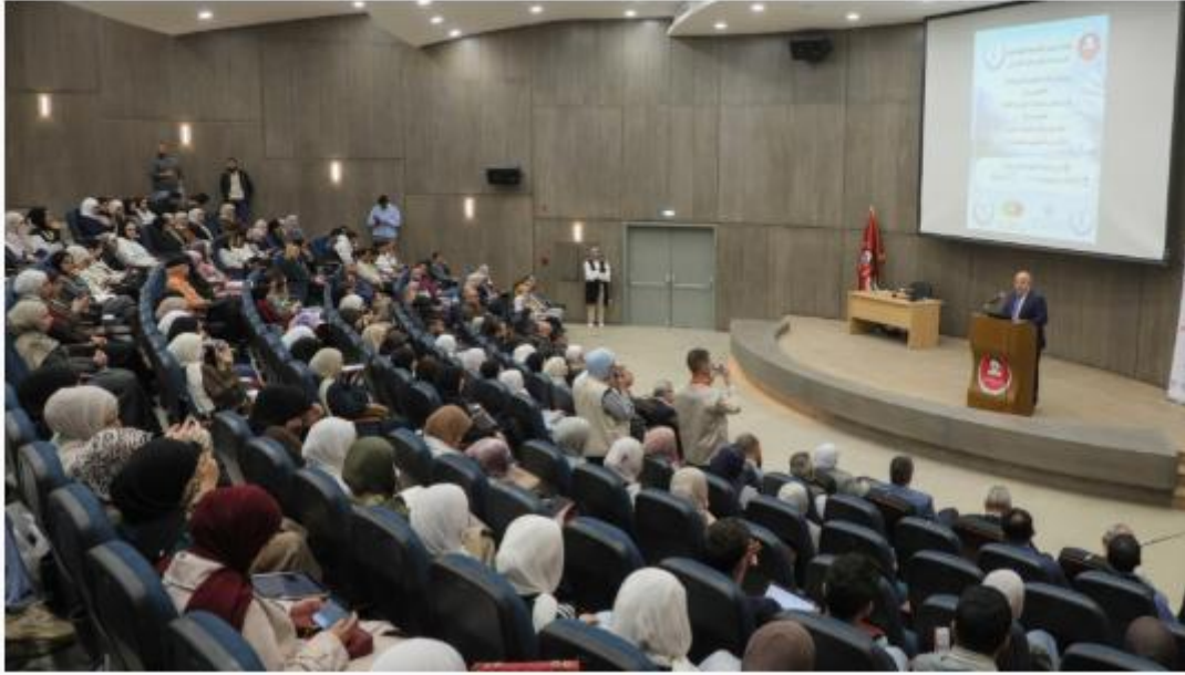
الشريط الإخباري :

خبر و صورة | 2026-04-14 | 06:31 pm - الثلاثاء